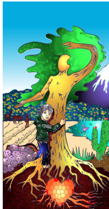
Ilustración: Ajax Sahueza

Le invitamos a que nos acompañe en la resistencia.